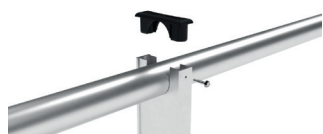
Mise en place de la lisse haute simplifiée Fixation rapide avec pré-perçage